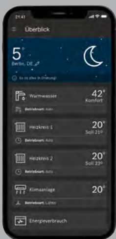
Aplikacja MyBuderus Cały system w jednej aplikacji