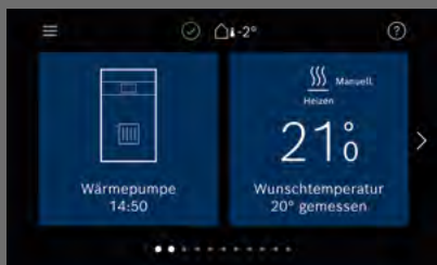
Logamatic BC400 jednostka sterująca systemem